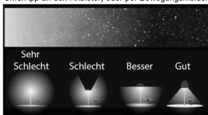
Abb. 2: Grade von Lichtverschmutzung durch unterschiedliche Strahlungsrichtung von Straßenlampen.

Zusätzlich kann die Lichtintensität verringert werden. Sowohl die räumlich als auch die zeitlich gezieltere Ausrichtung der Beleuchtung lässt sich gut mit LEDs umsetzen. Diese sind zudem Energiesparsam und langlebig. Nachteil ist der hohe Blauanteil am LED-Licht, der es heller erscheinen lässt und damit die Zyklen der verschiedenen Lebewesen negativ beeinflusst.