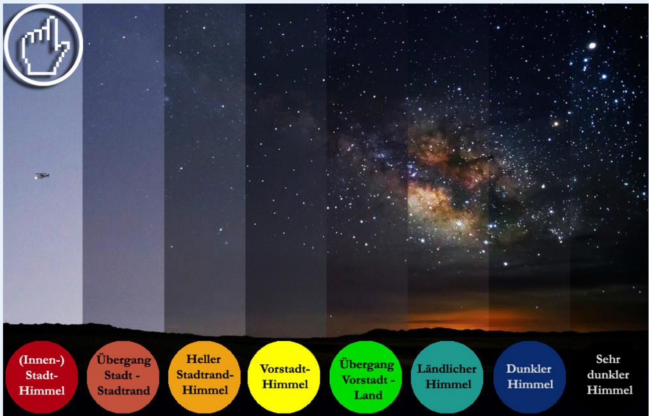
Marker 2: Abstufungen von Lichtverschmutzung im Umfeld von Städten In hell erleuchteten Innenstädten überstrahlt die künstliche Beleuchtung den Nachthimmel vollständig

„Für das Licht, das nach oben abgestrahlt wird, ist der Satellit prima“, erklärt Kyba. „Aber es geht eben auch Licht nach unten.“ Und da kommen die Messungen der ehrenamtlichen Hilfswissenschaftler ins Spiel. „Rund 20 Prozent der Eichdaten kamen von ‚citizen scientists‘. Ohne sie hätten wir keine Daten außerhalb Europas und Nordamerikas“, sagt der Forscher.