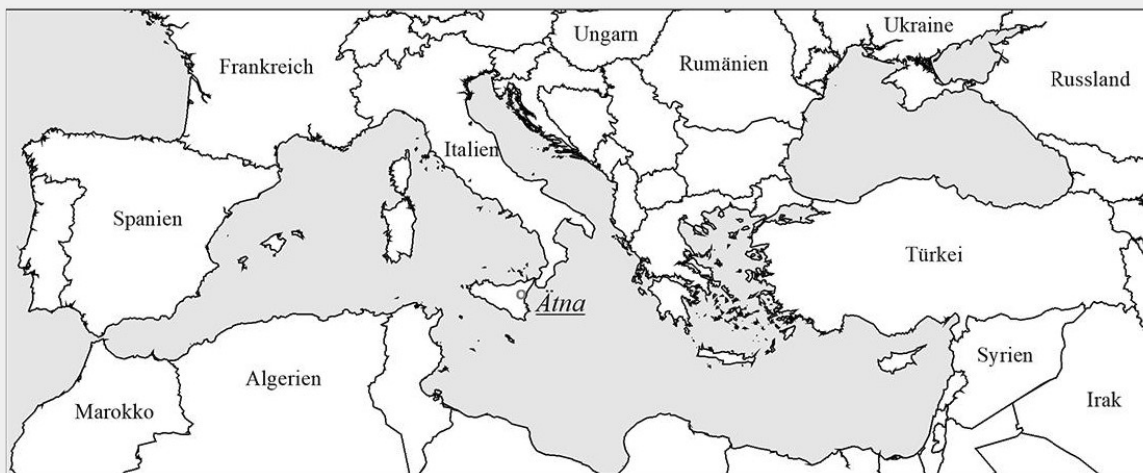
Marker 2: Karte des Mittelmeers mit Position des Untersuchungsgebietes Ätna.

Digitale Bilder bestehen aus Millionen von Bildelementen, den sogenannten Pixeln. Pixel sind die kleinste Flächeneinheit eines digitalen Bildes und können eine beliebige Farbe annehmen. Die digitale Bildverarbeitung befasst sich damit, diese Bilder mit entsprechenden Algorithmen zu verändern.